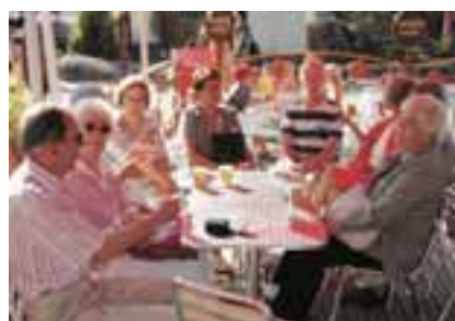
Tarinatuokio Tykkimäen virvoitusjuomapaikalla.