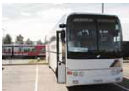
Savonlinjalta vuokrattu bussi Kouvolan asemalla odottamassa Sukujubliin tulijoita.

Bussin vuokraus Savonlinjalta sen sijaan oli simppeleä: ajopäällikkö katsoi tietokoneeltaan onko nimeni 'kanissa' ja kun ei ollut, sain tehdä vuokrasopimuksen. Firma hyväksyi minut kuskiksi ja siitä vaan sukuseuralle