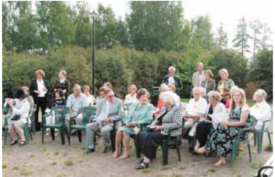
Kenttähartauteen osallistujia Korian Pioneeriravintolan edessä.

Sunnuntai-aamu 30.7.2006 koitti aurinkoisena. Aamupalan jälkeen alettiin valmistautua kenttähartauteen.