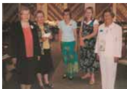
Kuvassa miltei puolet Hallituksen jäsenistä.