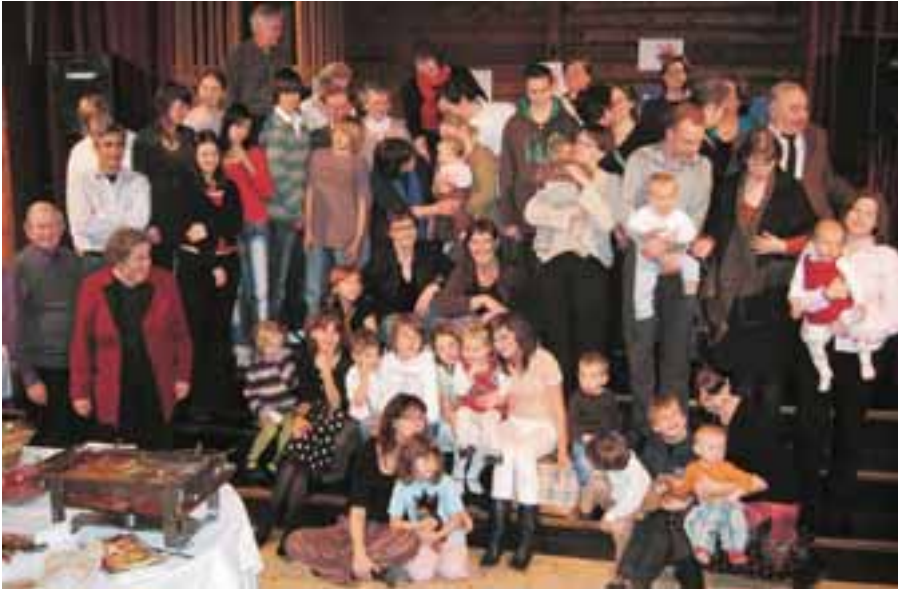
Me kaikki, paitsi tietysti kuvaajat!