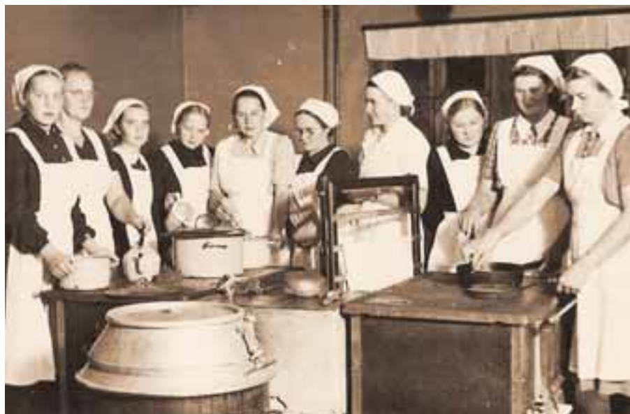
Keittiöpintoja Jyväskylän Kristillisessä Kansanopistossa.

Tekstit voi lähettää mieluiten sähköisessä muodossa, mutta myös käsin tai kirjoituskoneella kirjoitetut reseptit ja tarinat ovat tervetulleita.