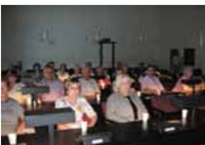
Sukuseuralaisia Kouvolan kaupunginvaltuuston työhuoneessa.

Kaupungintalolta siirryimme sitten Kouvolan museokortteliin. Sää suosi matkalaisia, oli lämmintä ja aurinkoista. Ihmeteltyämme kylliksi vanhoja puutaloja ja kauppvoja, starttasimme kohti Huvipuisto Tykkimäkeä. Jätin ryhmän sisään tuloportin eteen ja jatkoin matkaa parkkipaikalle. Palattuani kaikki olivat hävinneet kuin akanat tuuleen. Aikani kierreltyäni tapasinkin jo muutamia, jotka olivat majoittuneet limupullojen seuraan. Siinä olikin sitten hyvää aikaa kertoilla kuulumisia, etenkin kun muitakin liittyi parasollin varjoon limulle. Sukuhallitus alun perin ajatteli tätä retkeä lasten kannalta. Sääli vain, ettei lapsia ei tainnut olla montakaan matkassa, vaikka näyttivät ne vempheet kiinnostavan aikuisiakin. Ja miksi ei! Joku korkkiruuvi tai vastaava on ihan jees! Pienet hui'kaisut piristävät päivää.