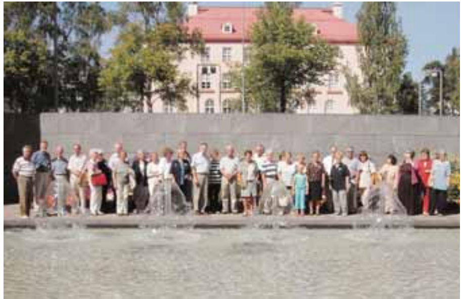
Sukuseuralaisia Kouvolan Kaupungintalon suihkulähdteen reunalla 29.7.2006

Talvikuukausina kiteytyivät niin paikan valinta kuin ohjelmakin. Kevät-auringon jo kilottaessa hangella, teimme porukalla paikkatarkistukset kuin myös aika- ja matkamittaukset eri paikkojen välillä. Sähköposteja kulki tiuhaan hallituksen jäsenten välillä kun piti sopia monista seikoista. Minun osuuteni oli neuvotella hinnoista ja aikatauluista, jotka muut sitten hyväksyivät tai eivät. Niinpä sainkin juosta Koriolla neuvottelemassa ties kuinka monesti. Huvipuisto Tykkimäki oli kinkkinen kohde: sieltä ei herunut juuri mitään ja todettiinkin yks'kantaan ettei voida antaa alennuksia. Ehkä neuvottelijana oli väärä mies.